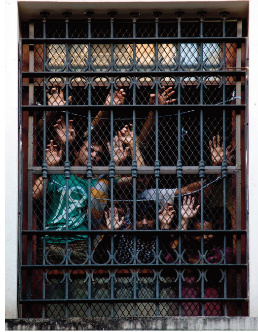
Kumkapı'da bulunan ve göçmenlerin barındırıldığı "Yabancılar Misafirhanesi"nden bir kare

"Bir gün bize uyuşturucu kullanan ama bundan kurtulmak isteyen bir Sudanlı geldi. Ben bu kişiyi Bakırköy Mazhar Osman Ruh ve Sinir Hastalıkları Hastanesine götürdüm. İlk önce Amatem Bölümüne gittik. Hasta kayıttaki adam bizim Sudanlının mülteci kağıdının buruşuk olduğunu ve kabul edemeyeceğini söyledi. Ben de, madde bağımlısı olduğunu söyledim. Arkadan, bu bölümde onu tedavi edemeyeceklerini ve bizim Acil Psikiyatriye gitmemizi söylediler. Biz Acil Psikiyatriye gittik. Bakırköy Hastanesi çok büyük ve insan yollarında kayboluyor. Acil psikiyatri bizi Amateme geri gönderdi. Amatem'de yine bizi Acil Psikiyatriye gönderdi. Bu arada ben neredeyse acil psikiyatri hastası olacaktım çünkü hasta çok acı