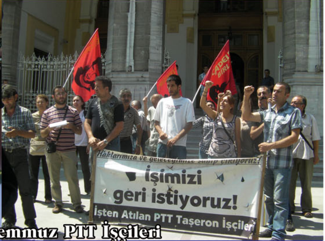
7-13 Temmuz PTT İşçileri