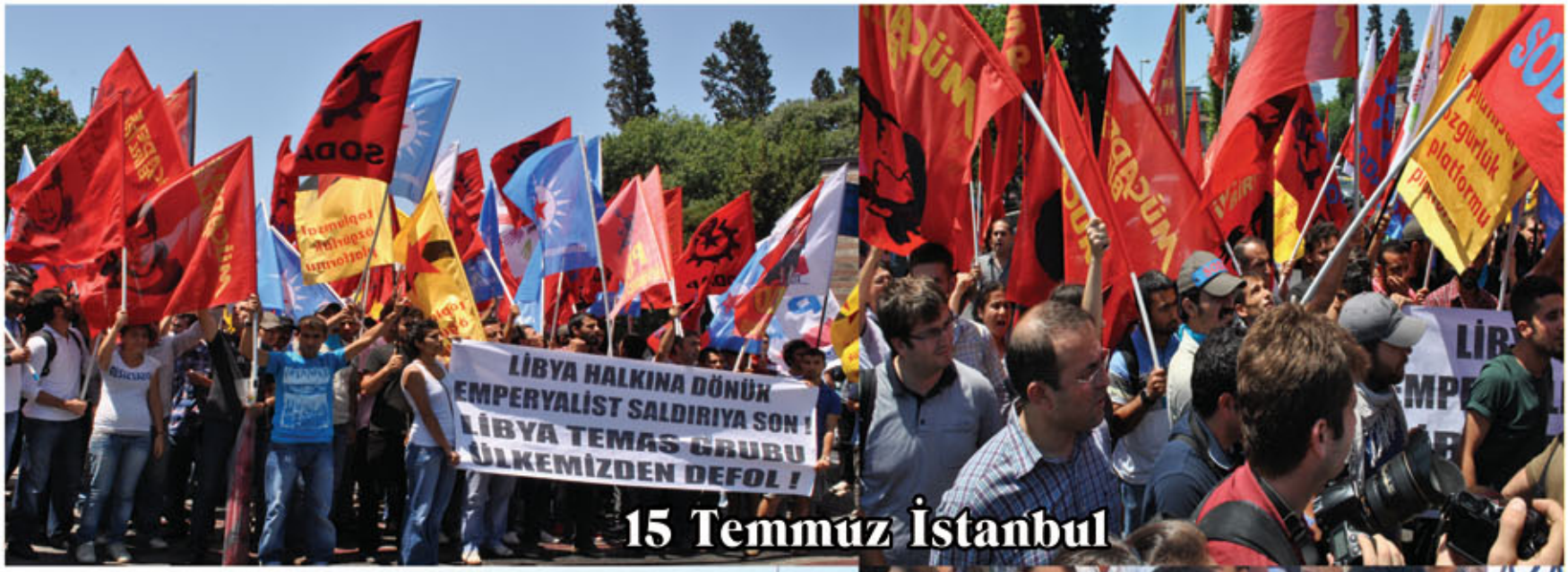
15 Temmuz İstanbul