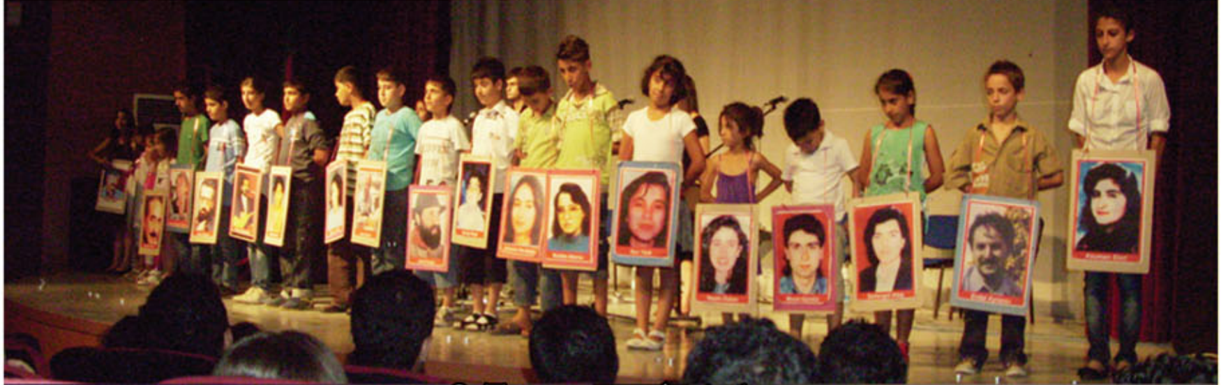
2 Temmuz Antakya