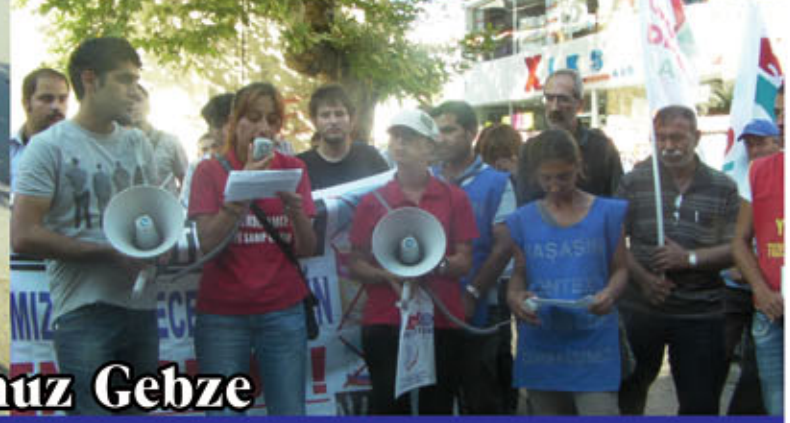
9 Temmuz Gebze