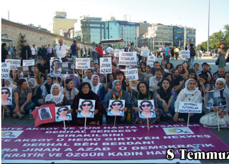
8 Temmuz Taksim