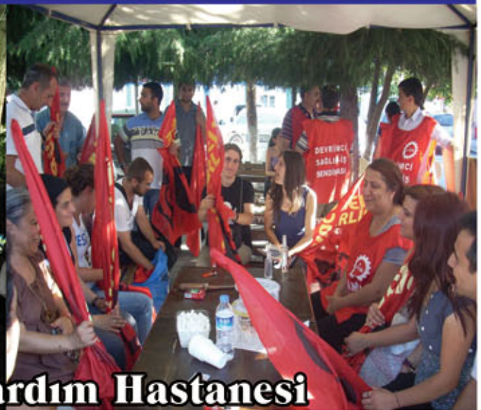
14-16 Temmuz Taksim İlk Yardım Hastanesi