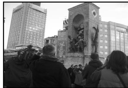
111. Sayı / 30 Ocak - 13 Şubat 2008

korunmak amaçlı binanın önu biraz boşaltılmıştı. Camlar indikçe alkışlar zılgıtlar sloganlar sürüyordu. Ve Agos Önünden Taksim Meydanı'na kadar atılan "Yaşasın Halkların Kardeşliği" sloganından eser kalmamıştı. Taksim Meydanı'nda bu sloganı atanlar dağıldı. İstiklal'de ise bir iki kez "Faşizme Karşı Omuz Omuz", "Kurtuluş Yok Tek Başına Ya Hep Beraber Ya Hiç Birimiz" sloganları atıldı. Ama yol boyunca tüm sloganlar ve inisiyatif Leninistlerin elindeydi.