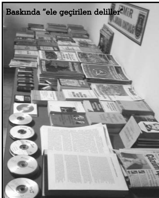
Baskında "ele geçirilen deliller"