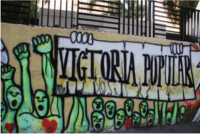
Venezuela halkının zaferini.