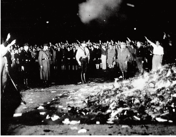
Berlin, Opernplatz'da Nazilerin kitap yakma töreni 10 Mayıs 1933

Buyurunca Hitler Hazretleri zararlı fikirlerle dolu kitapların yakılmasını halkın önünde, alanlarda, öküzler odun yığınlarına araba araba kitap taşıdı. Gözden düşmüş şairlerden biri, hem de en iyilerinden biri, şöyle bir göz gezdirdi yakılacak listesine, gitti aklı başından: Unutulmuştu kendi adı. Hemen seğırtti çalışma odasına, sanki öfkesinden kanatlanmıştı. O saat bir mektup karaladı zorbalara: 'Benimkileri de yakın!' dedi. 'Benimkileri de! Yapamazsınız bana bu kötülüğü, kenarda bırakamazsınız beni! Ben de hep gerçeği söylemedim mi kitaplarımda? Neden davranırsınız bana yalancıymuşum gibi? Yakın benimkileri de!