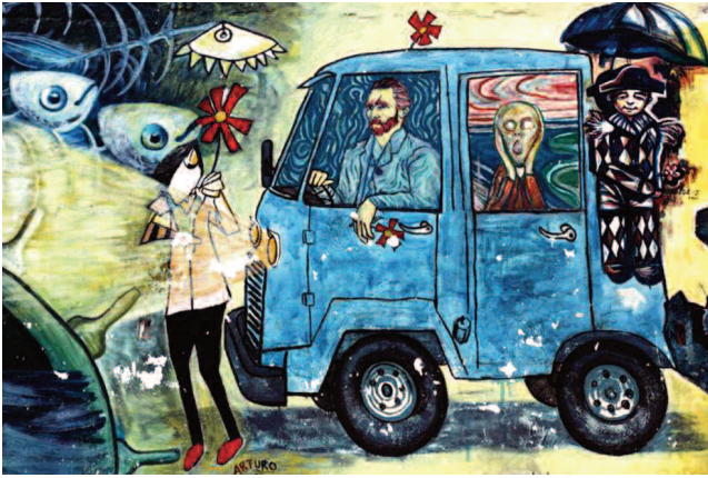
Kübalıların rengarenk dünyalarını.