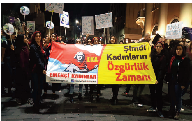
Kadınların zılgıt, alkış ve erbaneleri ile başlayan coşkulu yürüyüşü Kubaracı Yo-

kuş'a gelince polis barikatları ile kesildi. Sadece birkaç yüz metre yürüyebilmiş olan kadınların Galatasaray'a dahi yürütmesine izin vermeyen polis, eylemin bitirilmesini istedi.