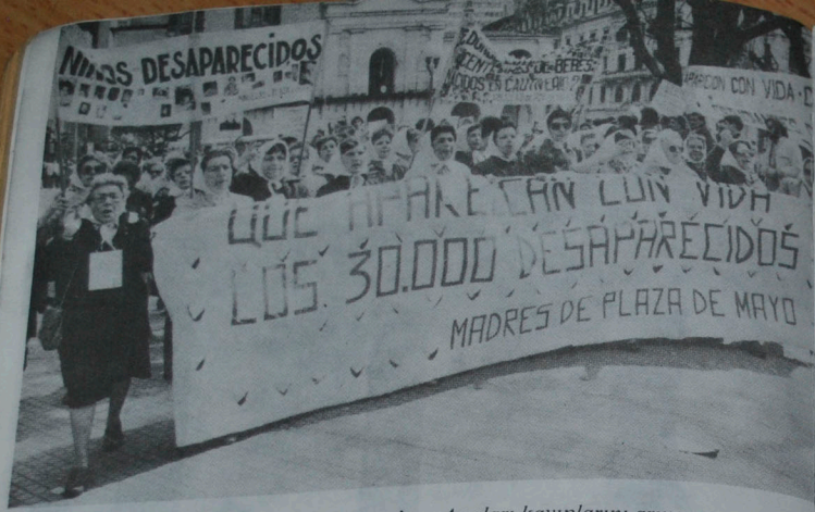
Arjantin 1985. Mayıs Meydanı'nın Anaları kayıplarını arıyor. Filistin'li kadın ülkesinin varolma savaşında erkeğiyle birlikte.