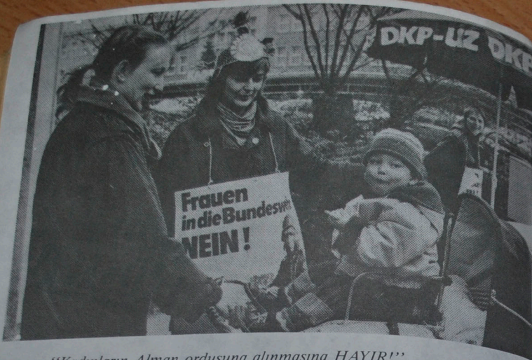
"Kadınların Alman ordusuna alınmasına HAYIR!"