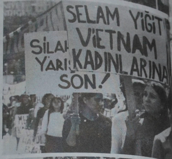
Uluslararası dayanışmanın bayrağını yükselten kadınlarımız... İzmir, 1 Mayıs 1979