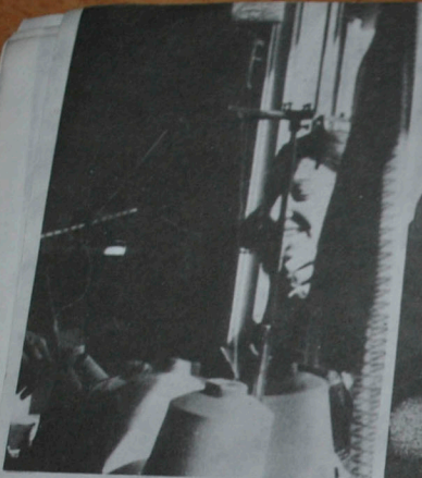
Sevgiyle saran, üreten kadın...