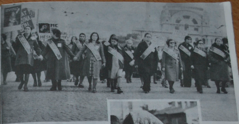
“Evlat acısına son” İstanbul 29 Şubat 1977