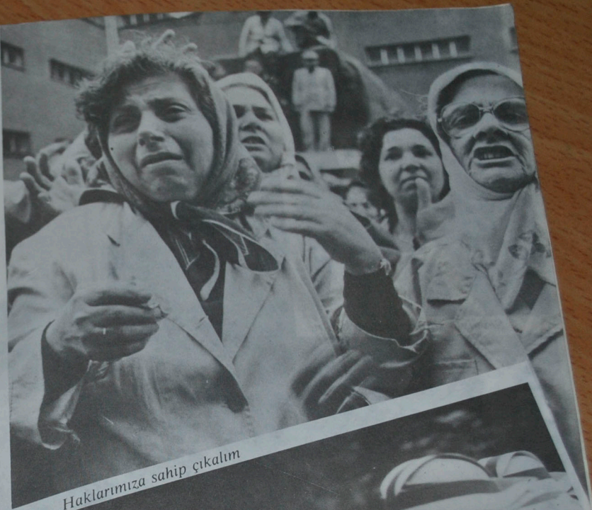
Haklarımıza sahip çıkalım