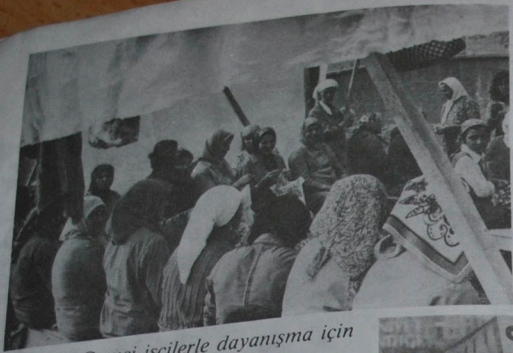
Grevci işçilerle dayanışma için toplu elişleri üretimi.