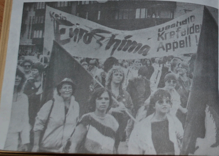
"Euro-Şima'ya hayır! Onun içinde Krefeld çağrısı"