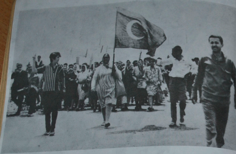
15-16 Haziran İşçi Direnişi, İstanbul 1970 Baskı ve zulüm cins ayrımı yapmıyor.