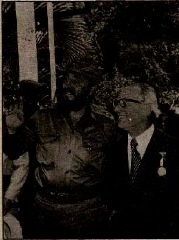
Honecker Fidel Castro ile birlikte

1945 yılında Kızıl Ordu, Hitler Almanya'sının kişiliğinde faşizmi yenerek, İkinci Dünya Savaşı'nı bitirdi. Bugün Normandiya çıkarmasına, dolayısıyla Hitler Almanya'sının emperyalist rakiplerine mal edilme çalışmaları başkanı, Honecker'ın tutukluğunun da sonu anlamına geliyordu. Savaşın bitiminde Avrupa'nın yeniden biçimlenişini gerçekleştirirken, Almanya'daki "Sovyet İşgal Bölgesi" 7 Ekim 1949'da Alman Demokratik Cumhuriyeti adıyla yeni bir sosya-