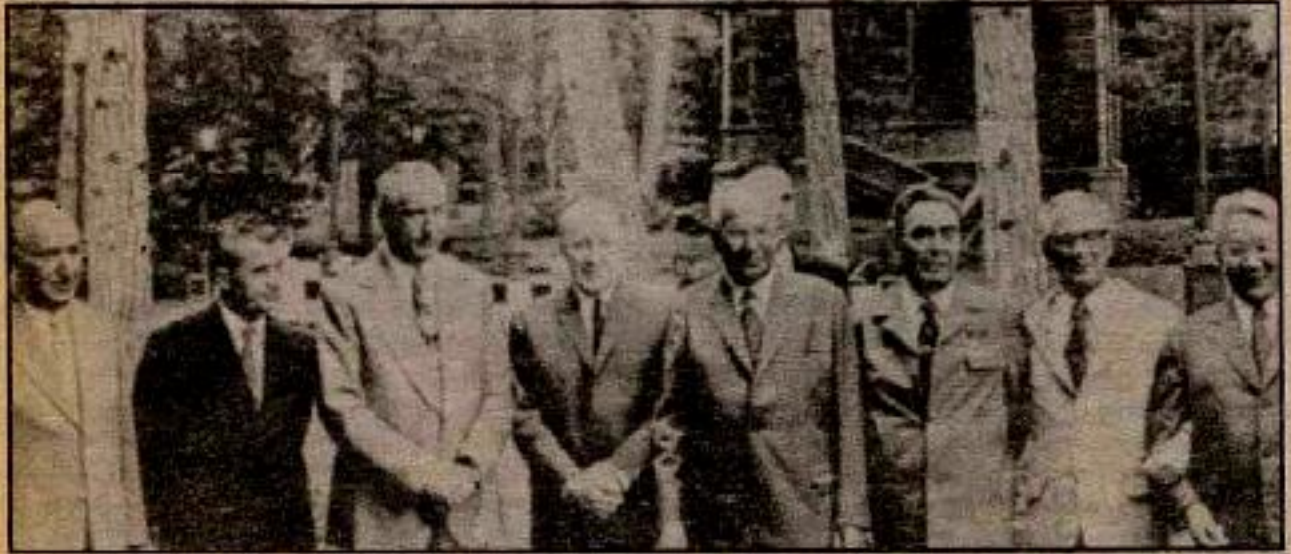
Temmuz 1973, soldan sağa Todor Jivkov, Nikolay Çavuşesku, Edward Gierek, Janus Kadar, Gustav Husak, Leonid İlyiç Brejnev, Erich Honecker ve Yumjaagyn Tsendenbal.

Çöküşün nedenlerinin henüz yeni yeni araştırılma-