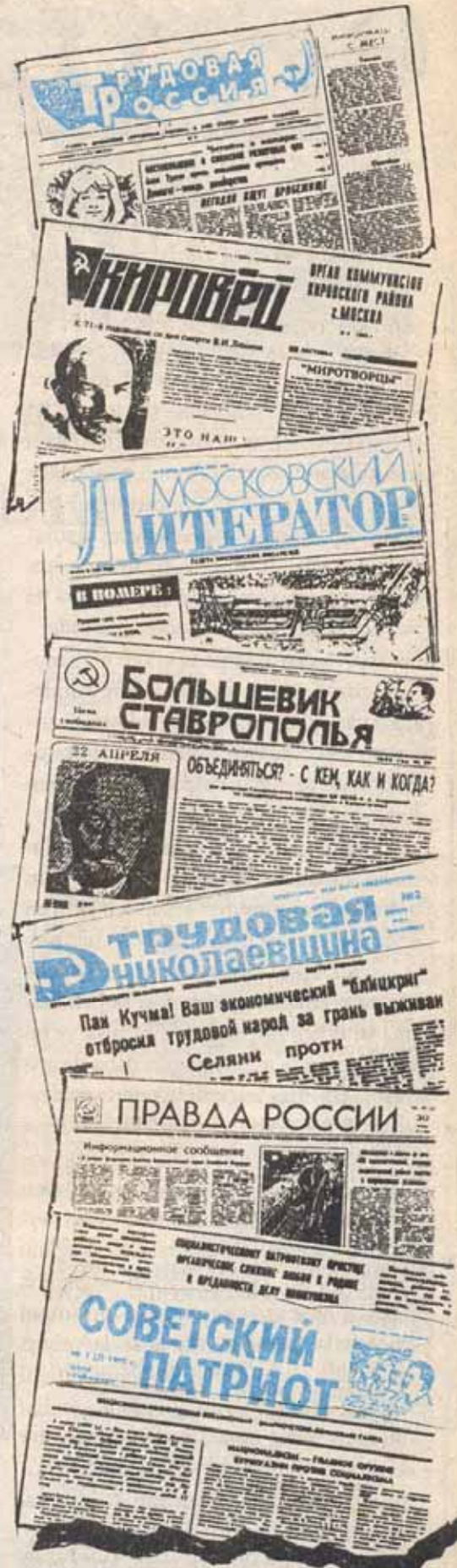
Rusya ve Ukrayna'da yayınlanan komünist gazetelerden birkaçı.

(Prag'ta yayınlanan POST-MARK PRAHA adlı gazeteden.)