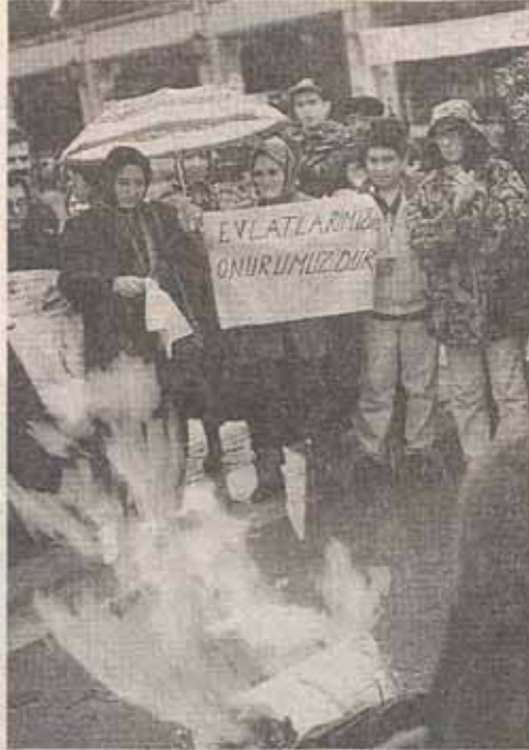
Tutsak Ailelerinin Özgürlük Meydanı Eylemi.

Devlet devrimci tutsakların yalnız olmadığını, yalnız bırakılmayacağını bili-