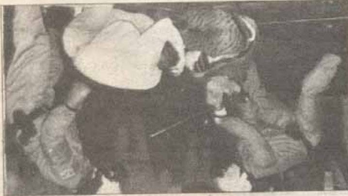
Almanya'da Nazi saldırılarına karşı protesto gösterisi yapan insanlara Alman polisi saldırdı.

Almanya'da ise "yüzyılın grevleri" yaşanmaya başladı. Bununla birlikte ırkçılık körüklenmeye başladı. Bizzat iktidardaki CDV partisi bir taraftan ırkçılığı körükleyerek bir taraftan da ona karşıymış gibi görünerek iki yüzlü politika oynuyor. Sanki işsizliğin sorunu yabancı sayısının ülkeye girişindeki artmış gibi gösterim Alman burjuvazisi basını yayını televizyonu ile ırkçılığın temellerini atıyor. Bu ülkede sosyal demokratların tavrı da ilginçtir. Geçmiş Hitler faşizminin iktidara gelmesine yardımcı olanlardan birisinin de o dönem ki Alman sosyal demokratları olduğu biliniyor. Bu dönem de yine aynı politikayı güderek Alman burjuvazisiyle tam bir mutabakat içindedir. Doğu ile Batı Almanya'nın birleşmekten dolayı problemleri çözülebilmemiş değil. Doğu Almanya'da söylenen yatırımları daha gerçekleştiremedi. İşsizlik çığ gibi büyüyor. Hala Doğu Almanlar kendilerini üvey evlat gibi görüyorlar. Alman burjuvazisi iğrenç politikasını bu alanda da devam ettiriyor. Son günlerde ki ırkçılık hareketlerinin ana kaynağını Doğu Almanya gösterip suçu yine geçmişteki sosyalist yönetime yıkmaya